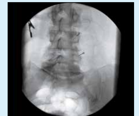
Процедура лечения болевого синдрома – система BV Endura позволяет врачам визуализировать введение иглы в области позвоночника.