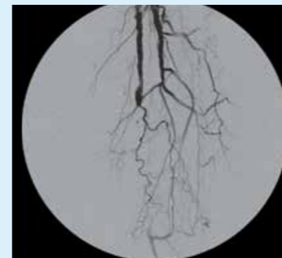
Ангиография нижних конечностей в режиме ЦСА позволяет визуализировать детали мелких сосудов с превосходным качеством.