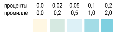
Цветовая шкала для полуколичественного определения КОНЦЕНТРАЦИИ АЛКОГОЛЯ

Неопределенный результат. В том случае, когда внешние грани сенсорного элемента полоски изменили окраску, но большая часть квадрата не изменила цвет, анализ необходимо повторить с обязательной гарантией полного смачивания сенсорного элемента полоски слюной.