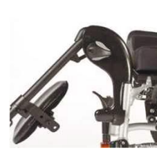
Подъемная опора для ног