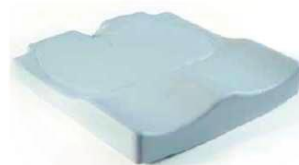
Jay Easy Visco (рисунок дан без обивки)