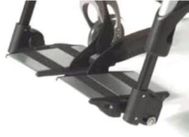
Раздельные, с регулируемыми углом и глубиной, алюмин.