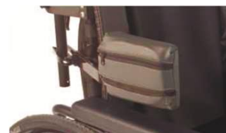
Опора для тела