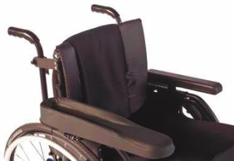
Прокладка подлокотника Нemi