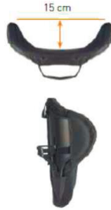
Спинка Jay 3 Глубокий контур