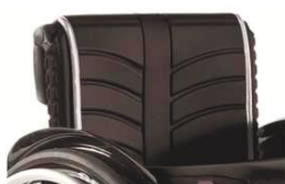
L11030316 Полотно для спинки EXO