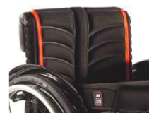
L11030317 Полотно для спинки EXO PRO