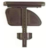
Регулируемое по высоте устройство одиночной опоры