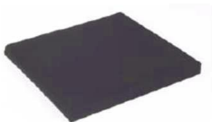
Подушка сиденья, чехол на «молнии», черный