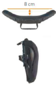
Спинка Jay 3 Средний контур