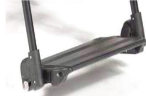
Платформа, с регулируемыми углом и глубиной, подъем., алюм.