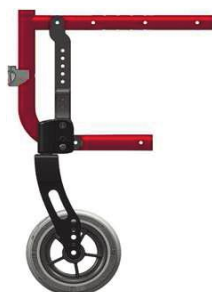
Неврологический вариант рамы