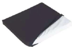
Подушка сиденья, кондиционирующая мембрана, водостойкая, чехол на «молнии», чёрный