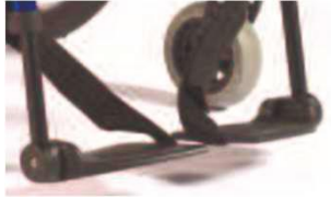
Раздельные пластины для стоп, с регулир. углом, композит.