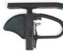
С одиночной опорой, с регулировкой по высоте