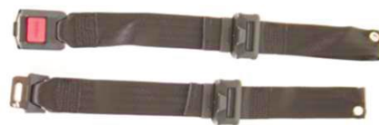
Ремень с замком для фиксации положения