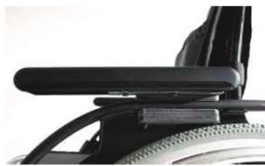
Регулируемое по высоте устройство подлокотника