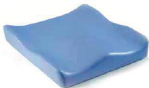
«Jay Soft Combi P» (рисунок дан без обивки)