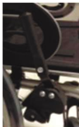
Удлинение для фикс. колеса с коленч. рычагом, вставляемое и поворот.-отводное