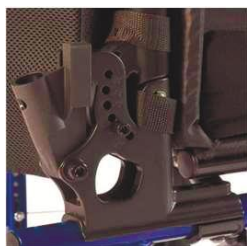
Спинка с регулируемым углом