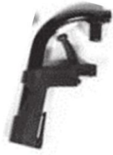
Композит. подвес. кроншт.