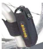
Кармашек для мобильного телефона