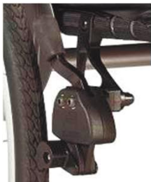
Фиксатор колеса с коленч. рычагом