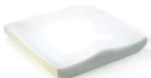
Jay Basic (рисунок дан без обивки)