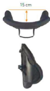
Спинка Jay 3 Глубокий контур средней зоны (MDC)