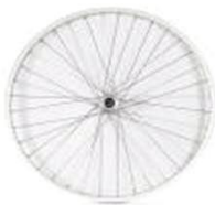
Универс. колесо с перекрещ. спицами