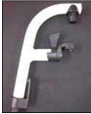
Алюм. подвесной кронштейн