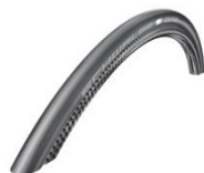
XES070107 Шина «Schwalbe One»