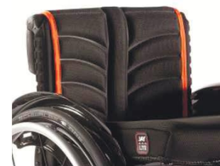
XES 030317 Обивка спинки EXO PRO