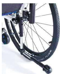
XES090004 Анти-опрокидыватель откидной