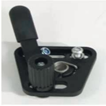
XES060001 Стандартный тормоз