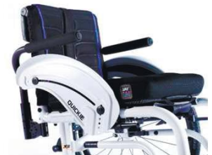
XES040117 Трубчатый подлокотник, поворотный, съемный, с набивкой