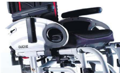
XES04000x Боковая защита в виде щитка, накладка для рук, откидная, съемная