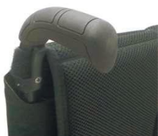
XES 030201 Рукоятки для толкания, длинные