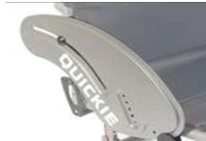
XES040102 Алюминий, защита от атмосферных воздействий