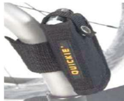
XES090026 Кармашек для мобильного телефона