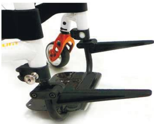
XES090019 Откидной кронштейн для сумок