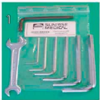
XES090000 Набор инструментов