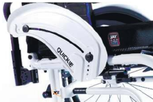
XES040103 Алюминий, защита от атмосферных воздействий, щиток