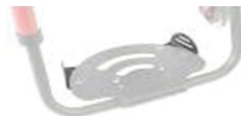
XES050127 Регулируемая боковая защита