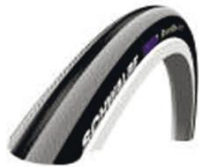
XES070101 Schwalbe Right Run