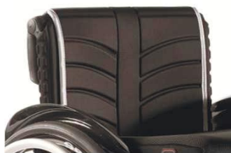
XES 030316 Обивка спинки EXO