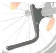
XES090001 Рычаг для опрокидывания