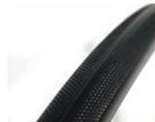
XES070102 Шина, защита от прокола