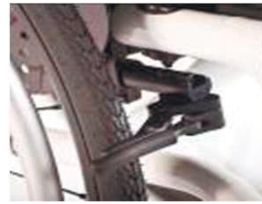
XES060003 Компактный тормоз