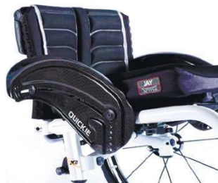
XES040104 Карбоновое волокно, защита от атмосферных воздействий, щиток