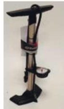
XES090024 Насос высокого давления