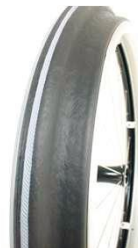
XES070208 Облучи Махгрепп