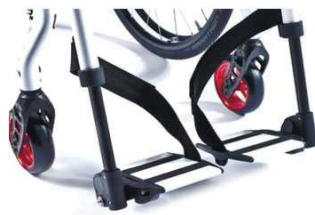
XES050022 Платформа, разд., из алюм., цвет рамы