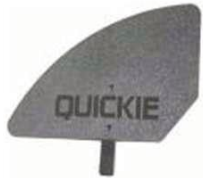
XES040107 Съемное боковая защита из пластика