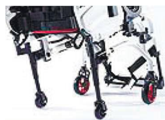
XES090010 Транзитные колеса