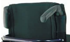
XES 030203 Складные рукоятки для толкания