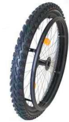
XES07010 Колесо Mountainbike