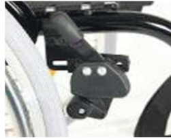
XES060002 Тормоз с коленчатым рычагом