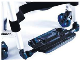
XES050132 Платформа, моно, облегч., карбон.