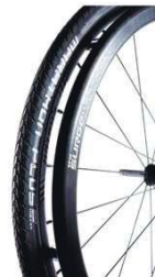
XES070211 Облучи Surge ©