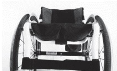
XES 020003 Обивка сиденья с 2 карманами для принадлежностей