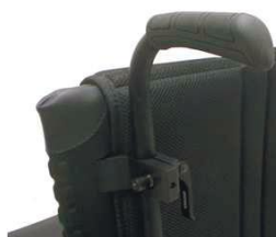
XES 030204 Рукоятки для толкания, рег. по высоте