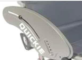
XFF040102 Из алюминия, устойчивое к воздействию низких температур