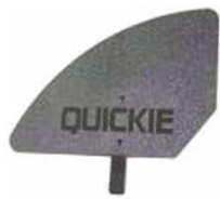
XFF040107 Композитная боковая защита, съемная