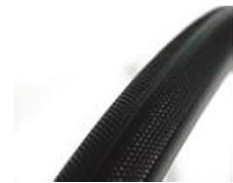
XFF070102 Шина, с защитой от прокола