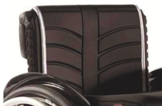
XFF 030316 Полотно спинки EXO