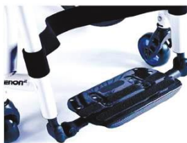
XFF050132 Пластина для стоп в виде платформы, облегч., из карб. волокна