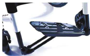
XFF050027 Пластина для стоп в виде платформы, облегч., из карб. волокна, автом. склад.