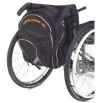
XFF090030 Комплект спинки