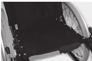
XFF 020002 Полотно сиденья с 1 карм. для принадл.