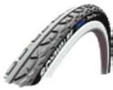
XFF070106 «Schwalbe Down Town»