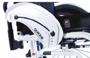
XFF040103 Из алюминия, устойчивое к воздействию низких температур, с ограждением