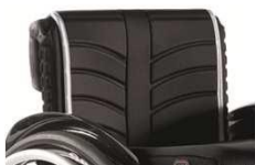
Полотно спинки EXO