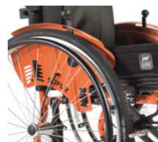
Тормоз нажимного действия, встроенный в бок. защиту, тип «сафари»