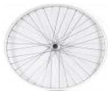
Заднее колесо, универсальное, 36 спиц, перекрещенные спицы