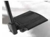
Пластина для стоп, отдельная, алюм., регул угол, откидн. (в сторону), с петлей для пятки, черная