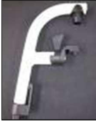
Алюм. подвес. кроншт. 110° / 100°