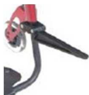
Откидной кронштейн для сумок Caddy