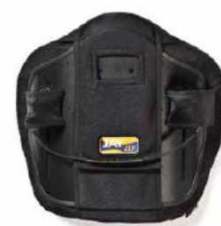
Спинка Jay Zip