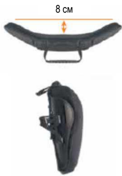
Спинка Jay 3 Средний контур