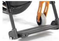
Пластина для стоп, отдельная, композит., откидн. (в сторону), с петлей для пятки, черная