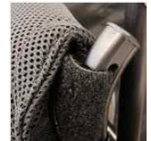
Без рукояток для толкания