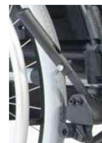
Тормоз нажимн. действия, упр. одной рукой, привод справа