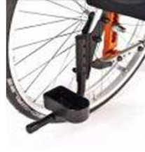
Кронштейн для костьля, петля