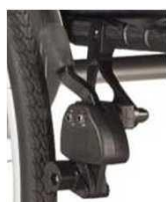
Тормоз с колесчатым рычагом