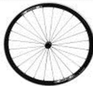
Заднее колесо Proton, 24 спицы, прямые спицы