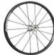
Заднее колесо, «Spinergeru», 18 спиц (черные), прямые спицы; втулка: серебристая