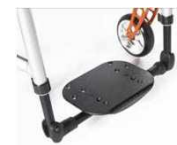
Пластина для стоп в виде платф., облегченная, пластик., угол и глубина регул., откид. (в сторону), с ремнем для икр