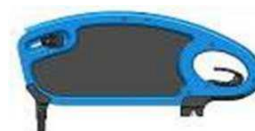
Боковая защита в виде щитка, откидная, съёмная