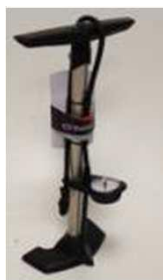
Насос высокого давления