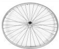
Заднее колесо, дизайнерское, 36 спиц, прямые спицы