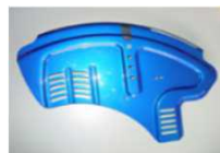
Алюм. бок. защита, с ограждением, устойчивая к атмосф. возд. (цвета рамы)