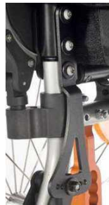
Спинка с регулируемым углом