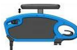
Бок. защита в виде щитка, регулируемая по высоте, откидная, съёмная