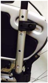
Трубка спинки, алюминиевая