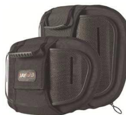
Карбоновая спинка Jay 3 Неглубокий контур