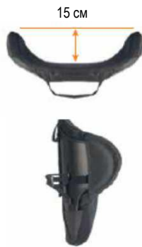
Спинка Jay 3 Глубокий контур