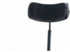
Подголовник, высота, глубина и угол регулируются