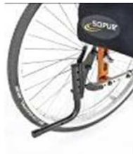
Устройство для облегчения наклона