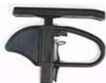
Одиночная опора, с регулировкой по высоте