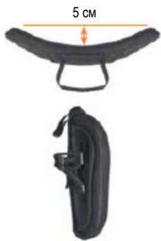
Спинка Jay 3 Неглубокий контур