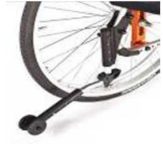
Трубки против опрокид., пов.-отводные, слева