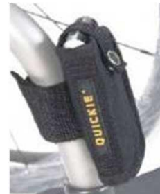
Кармашек для мобильного телефона