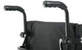
Регулируемые по высоте рукоятки