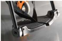
Пластина для стоп, отдельная, композит., откидн. (в сторону), с петлей для пятки, черная