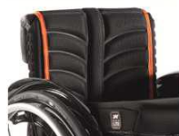
Полотно спинки EXO PRO