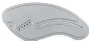
Алюм. бок. защита, устойчивая к атмосфер. воздействиям (цвета рамы)