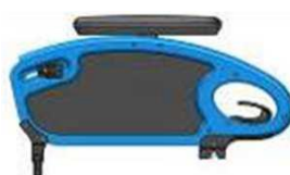
Бок. защита в виде щитка, с прокладкой для рук, фикс., откид., съёмная