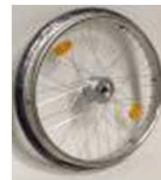
Заднее колесо, барабан. тормоз, 36 спиц, перекрещенные спицы