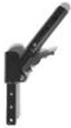
Спинка, склад. пополам (назад)