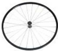
Заднее колесо, облегченное, 24 спицы, прямые спицы