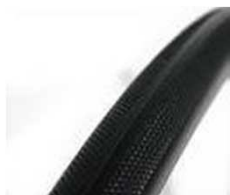
Шина, защита от прокола, протектор