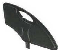
Пластиковая бок. защита, съёмная (чёрная)