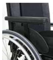
Бок. защита с один. основанием, с прокладкой для рук, регул. по высоте, съёмная