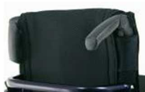
Рукоятки для толкания, складные