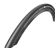
Шина, пневматическая, гладкая, «Schwalbe One»