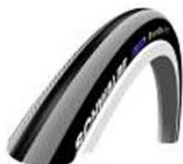
Шина, пневматическая, мелкий профиль, Schwalbe Right Run