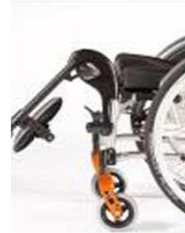
Подъемная опора для ног (ELR)