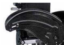
Карбон. бок. защита, с ограждением, уст. к атмосфер. возд. (чёрная)