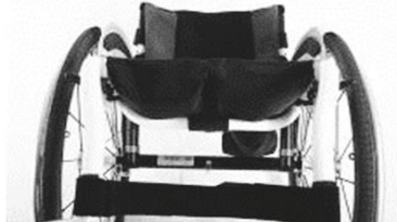
NSW020003 Полотно сиденья с 2 карманами для принадлежностей