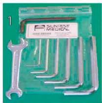
NSW090000 Набор инструментов