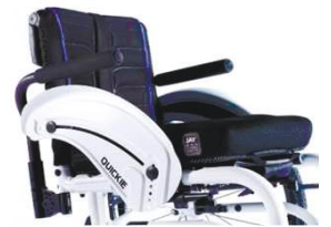
NSW040117 Трубчатый подлокотник, поворотный, съемный, с набивкой