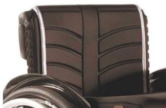
NSW030316 Полотно спинки EXO