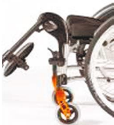
NSW050011 Кронштейн, алюминиевый, откидной (0-90°), поворотный