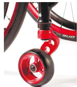
NSW080008 Вилка ролика, алюминий, для управления одной рукой, красного цвета