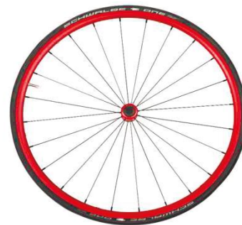
NSW100338 Облегченное колесо, анодированное, красное