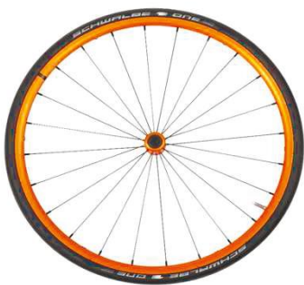
NSW100336 Облегченное колесо, анодированное, оранжевое