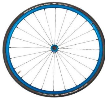
NSW100337 Облегченное колесо, анодированное, синее