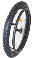
NSW070010 Колесо Mountainbike