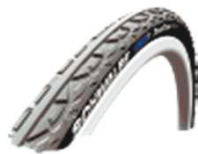
NSW070106 Schwalbe Down Town