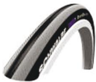
NSW070101 Schwalbe Right Run