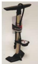
NSW090024 Насос высокого давления