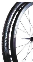
NSW070211 Обручи Surge ®