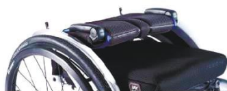
NSW030031 Спинка, складная