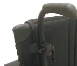
NSW030204 Рукоятки для толкания, регулируемые по высоте