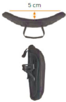
Спинка Jay 3 Неглубокая конфигурация