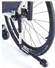
NSW090006 Поворотно-отводные трубки для защиты от опрокидывания