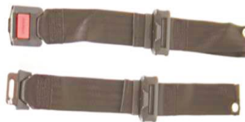
NSW090018 Ремень для фиксации колен с металлической пряжкой