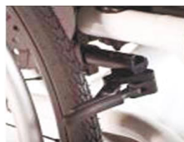
NSW060003 Компактный тормоз