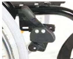
NSW060002 Тормоз с коленчатым рычагом