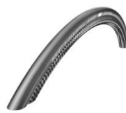
NSW070107 Шина «Schwalbe One»