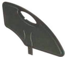
NSW040107 Боковая защита, из композитного материала, съемная (черного цвета)