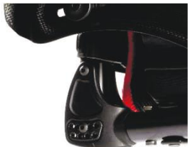
NSW030012 Спинка, с регулировкой угла