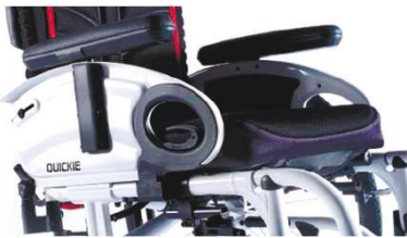
NSW04000x Боковая защита в виде щитка, накладка для рук, откидная, съемная