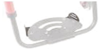
NSW050127 Регулируемая боковая защита