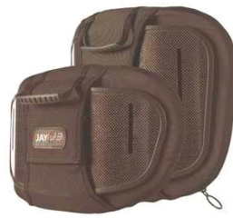
Карбоновая спинка Jay 3 Неглубокая конфигурация