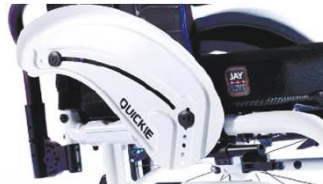
NSW040103 Алюминий, защита от атмосферных воздействий, щиток