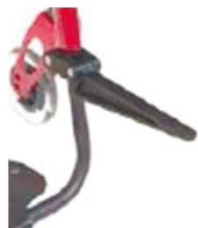
NSW090019 Откидной кронштейн для сумок