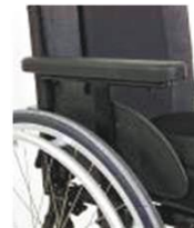
NSW040052 Боковая защита с одиночной опорой, накладка для рук (33 см)