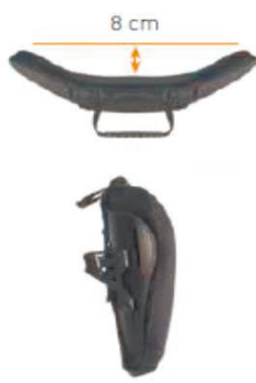
Спинка Jay 3 Средняя конфигурация