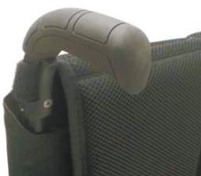
NSW030201 Рукоятки для толкания, длинные