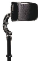
NSW030412 Подголовник, средний