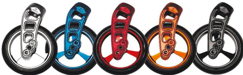
NSW080013 и NSW080306 Вилка ролика, Carbotecture и Ролик твердый (мягкий), алюминий