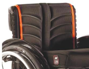
NSW030317 Полотно спинки EXO PRO