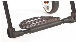
NSW050059 Основание для стоп, платформа, функциональное