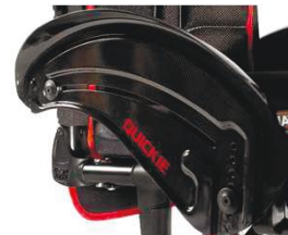
NSW040104 Карбоновое волокно, защита от атмосферных воздействий, щиток