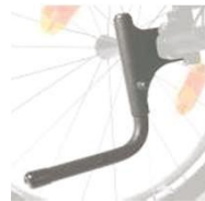
NSW090001 Устройство для наклона