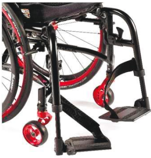
NSW050022 Основание для стоп, раздельное, из алюм., цвет рамы