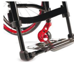
NSW050132 Основание для стоп, платформа, облегченное, карбоновое волокно