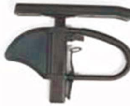
NSW040050 Боковая защита с одиночной опорой