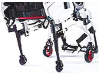
NSW090010 Транзитные колеса