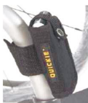
NSW090026 Кармашек для мобильного телефона