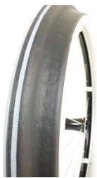
NSW070208 Обручи Maxgrip