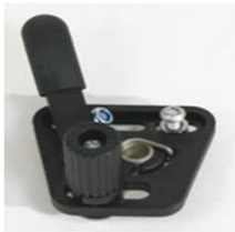
NSW060001 Стандартный тормоз