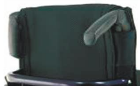
NSW030203 Складные рукоятки для толкания