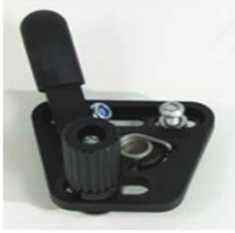
XFF060001 Стандартный тормоз