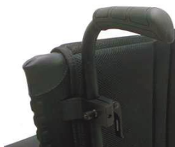
XFF 030204 Рукоятки для толкания с рег. по высоте