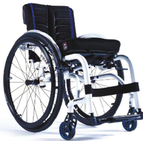
XFF090020 / 21 рама «Гибрид»