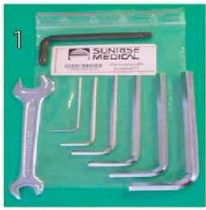
XFF090000 Набор инструментов