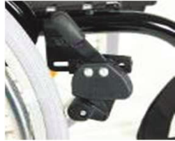
XFF060002 Тормоз с коленчатым рычагом