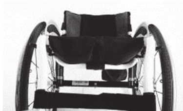
XFF 020003 Полотно сиденья с 2 карманами для принадл.