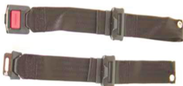
XFF 090018 Ремень для фиксации колен с металлической пряжкой

Схема складывания для спинки XFF 030031, складывается вперед.