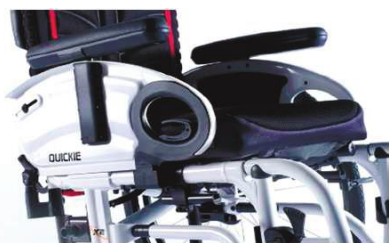
XFF04000x Боковая защита в виде щитка, откидная, с прокладкой для рук, съемная