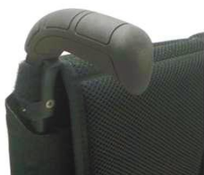
XFF 030201 Длинные рукоятки для толкания