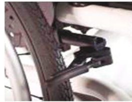
XFF060003 Компактный тормоз