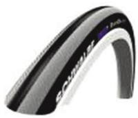
XFF070101 «Schwalbe Right Run»