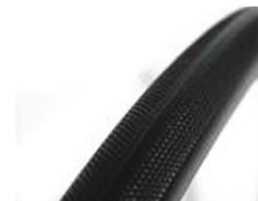
XFF070102 Шина, с защитой от прокола