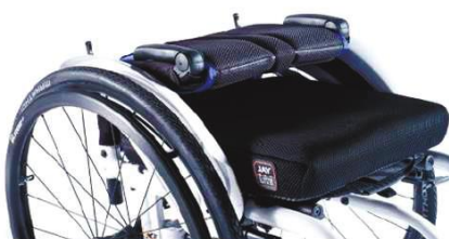
Схема складывания для спинки XFF 030031, складывается вперед.