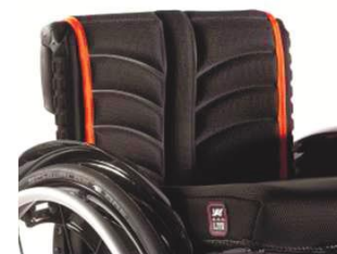
XFF 030317 Полотно спинки EXO PRO