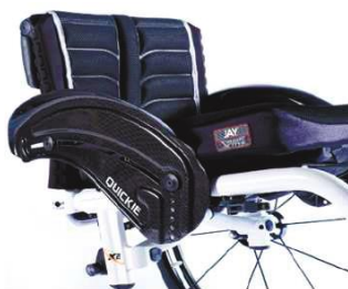
XFF040104 Из карб. волокна, устойчивое к воздействию низких температур, с ограждением