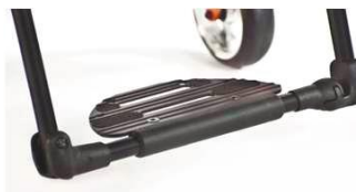
XFF050059 Пластина для стоп в виде платформы, функц.