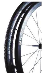
XFF070211 Обручи Surge®