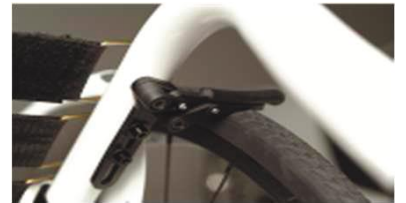
XFF060004 Облегченный компактный тормоз