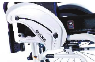
XFF040103 Из алюминия, устойчивое к воздействию низких температур, с ограждением