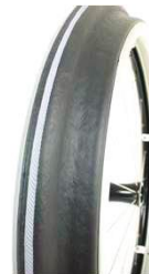
XFF070208 Обручи Maxgripp