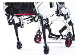
XFF090010 Транзитные колеса