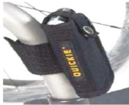
XFF090026 Кармашек для мобильного телефона