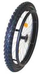
XFF07010 Колесо Mountainbike