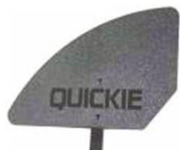
XFF040107 Композитная боковая защита, съемная