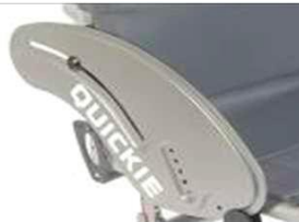
XFF040102 Из алюминия, устойчивое к воздействию низких температур