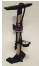
XFF090024 Насос высокого давления