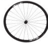
XFF07000 Колесо Proton