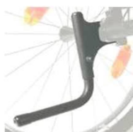
XFF090001 Устройство для облегчения наклона