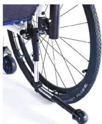
XFF090004 Трубки против опрокидывания, поворотно-отводные