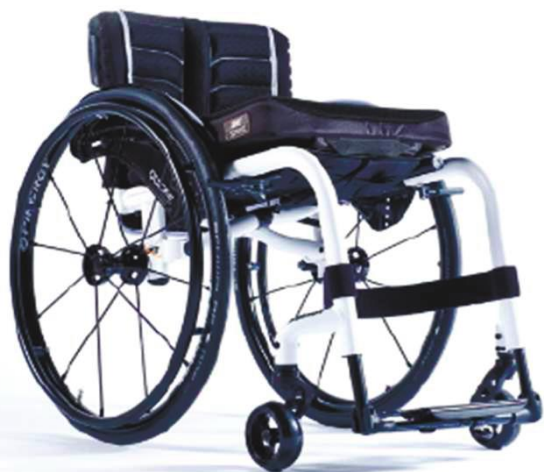
XFF010012 / 13 Открытая рама