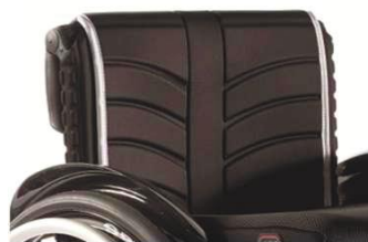
XFF 030316 Полотно спинки EXO