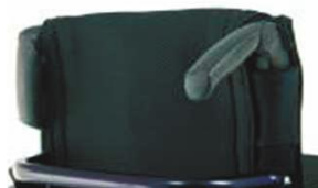
XFF 030203 Складывающиеся рукоятки для толкания