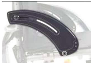
XFF040101 Из карб. волокна, устойчивое к воздействию низких температур, тонкое