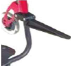
XFF090019 Откидной кронштейн для сумок