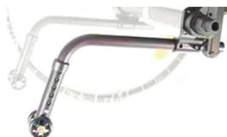
XFF090050 Трубки против опрокидывания, вставные, пара