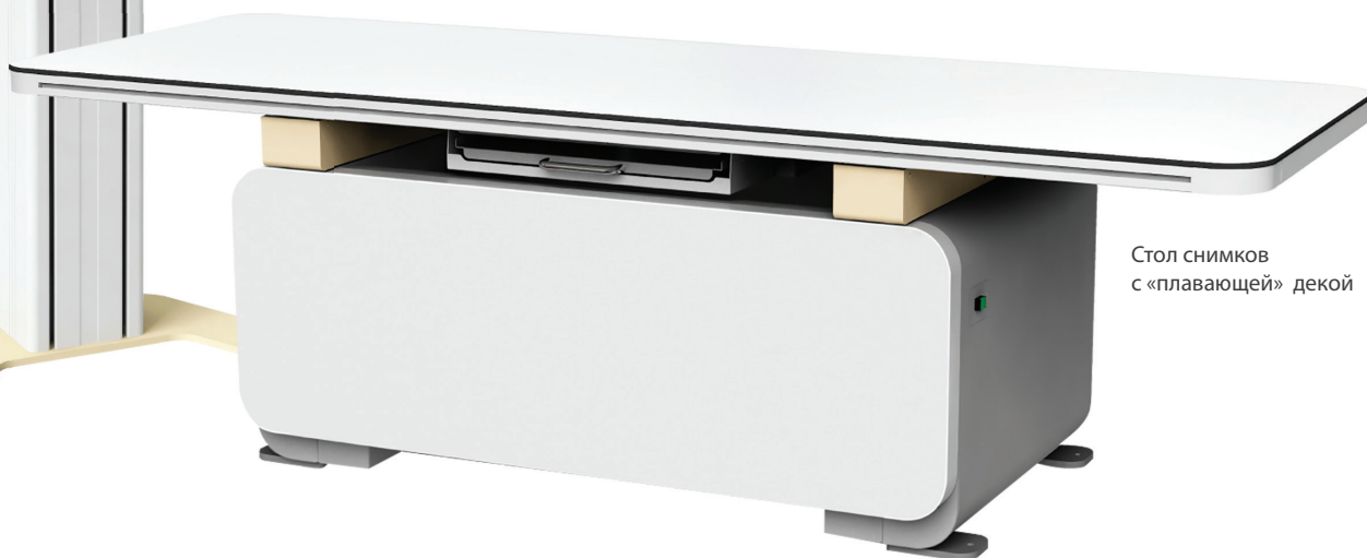
Стол снимков с «плавающей» декой