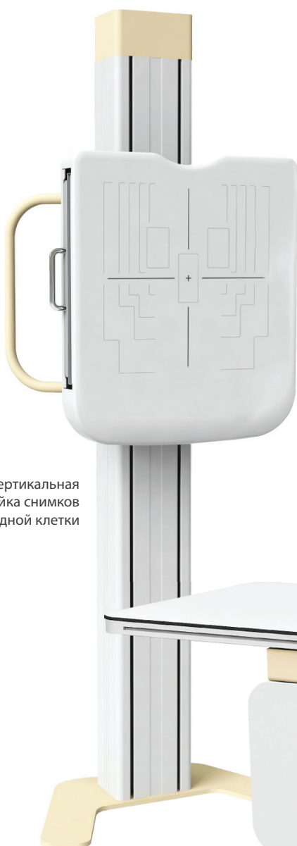
Вертикальная стойка снимков грудной клетки

На выбор предоставляется ряд генераторов низкой, средней и высокой мощности, позволяя варьировать уровень энергопотребления и максимальные параметры экспозиции. При ограничениях питающей сети, генератор может быть адаптирован под однофазное напряжение 220В, с максимальным потреблением 5 кВт.